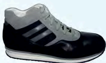
art. BERK 02