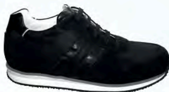
art. NAX 02