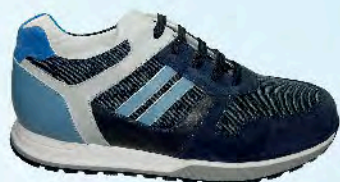
art. COLMAR 01

Un morbido plantare per un appoggio del piede e una distribuzione del peso corporeo ottimali. Predisposte per la sostituzione all'occorrenza con il Tuo plantare personalizzato.