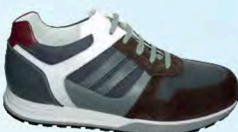
art. COLMAR 05