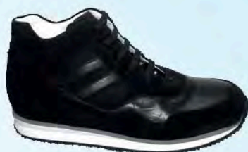
art. BERK 03