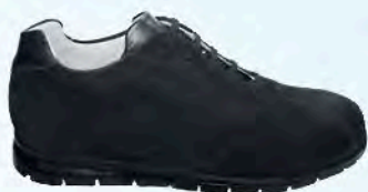
art. SNEEK grigio