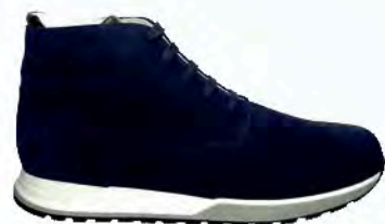
art. BOBBIO blu