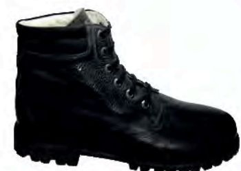
art. BORMIO nero