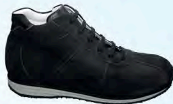
art. TIEL nero