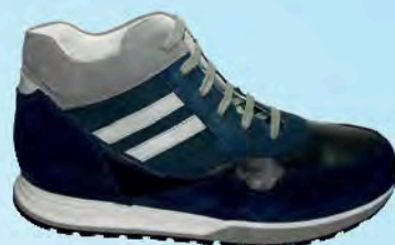
art. BERK 01