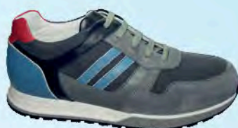
art. COLMAR 02