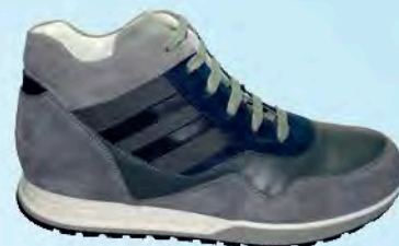
art. BERK 04