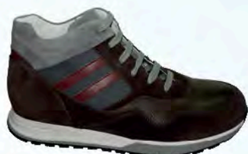
art. BERK 05