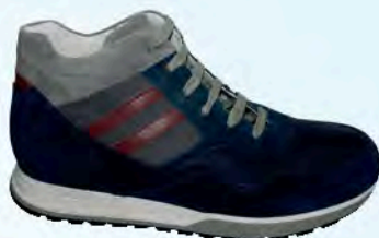
art. BERK 06