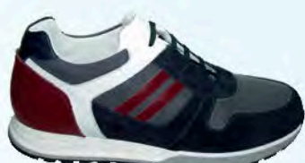
art. COLMAR 04