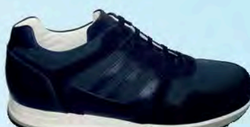
art. COLMAR 06