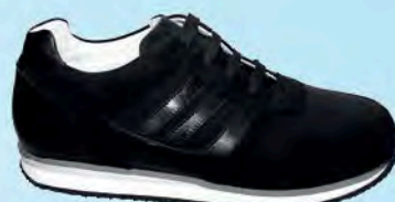
art. COLMAR 03